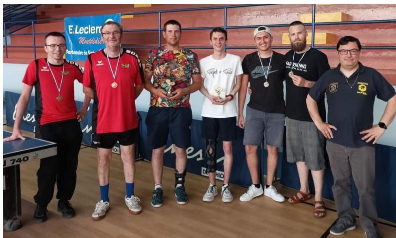
TABLEAU GASTON HARDY (-1200PTS)