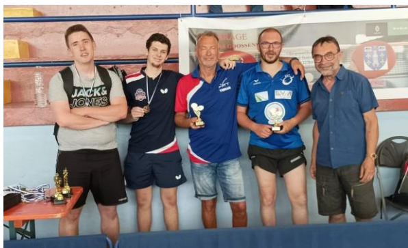
TABLEAU YVES LEFEBVRE (- 3000 PTS)