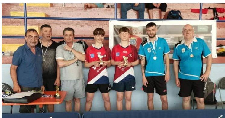
TABLEAU ANDRE DEBOUBERT (-1800 PTS)